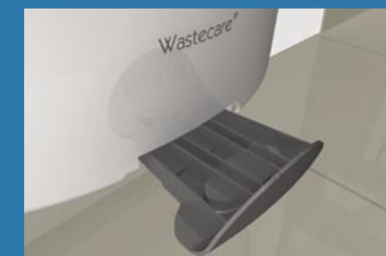
Front cover lock