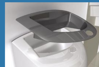
Removable chute for cleaning